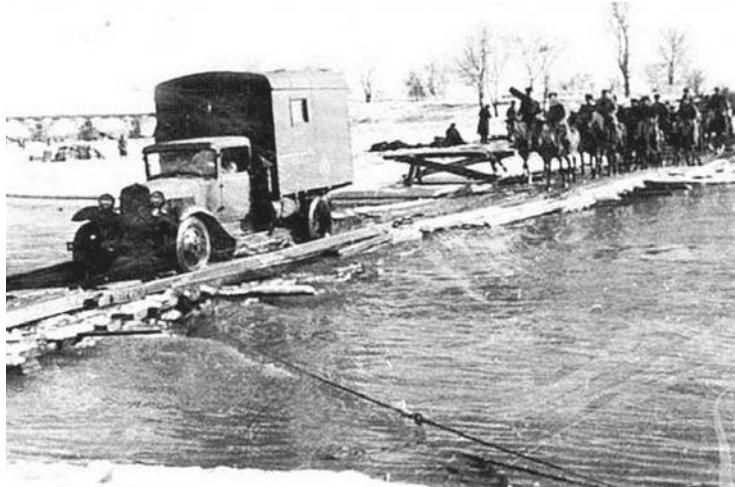
Декабрь 1942 года. Район Моздока. Автомобиль «ГАЗ-АА» и кавалерия движутся к фронту, пересекая Терек.